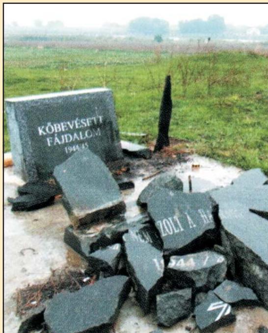
Az 1944-es szerb megtorlás áldozatainak összetört emlékműve. Csurog, 2008