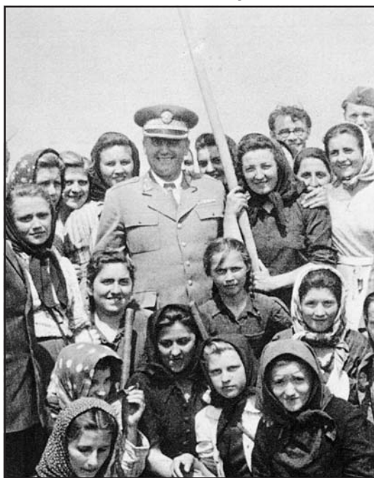
Tito marsall a Szerémségben, 1945

Az OZNA és a megtorlások történetének, mozaikrugóinak megismerése nem reménytelen vállalkozás. Ezt bizonyítja a Horvát Történelmi Intézet munkatársai által pár évvel ezelőtt kiadott két dokumentumkötet