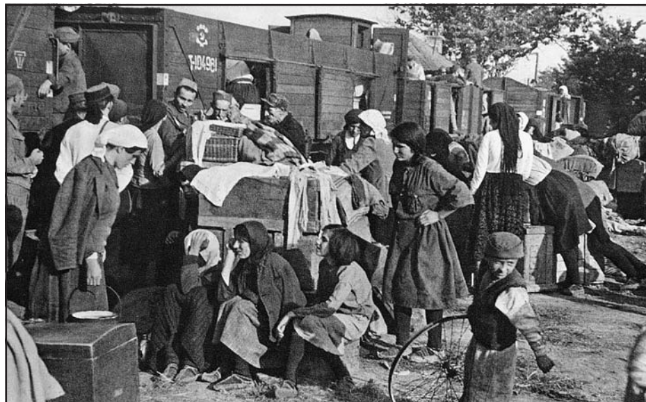
A földreform eredményeként nincstelen szerb parasztokat költöztetnek a Vajdaságba. Szerb telepések a pályaudvaron, 1945

A jugoszláviai, a szerbiai, de a rendszer-váltás előtti magyar történetírásban is, az 1944/1945-ös, magyarok elleni partizán megtorlásokat évtizedekig mély hallgatás vette körül. A „győzelem mindent igazol” tételéből kiindulva a jugoszláv politika által rövid pórázon tartott történetírás letagadta, illetve hamis módon, szükséges igazságtételként állította be a „fasiszta magyarok” és a kollektív bűnösnek nyilvánított németek elleni megtorlásokat. Szerbiában még a Jugoszlávia szétbomlása utáni évtizedekben is mindent megtettek, hogy eljelenéktelenítsék és meghamisítsák a megtorlásokat – „a magyarok elleni kilengések” eufemisztikus kifejezését használva. A hallgatás és a tagadás kezdettől fogva azt a célt szolgálta, hogy tisztára mossák és heroizálják az új partizán elit hatalomra kerülésének és kisebbségpolitikájának keletkezéstörténetét. E hamis történetzemplélet szerint a büntetés és számonkérés igazságos volt, az kizárólag a háborús bűnösök és a „nép ellenségei” ellen irányult, és „Jugoszlávia népeit szolgálta”.