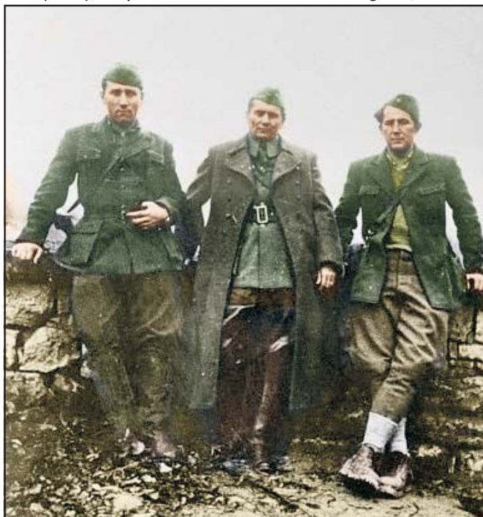
Aleksandar Ranković későbbi belügyminiszter és az OZNA vezetője (balról), Josip Broz Tito és Milovan Đilas társaságában, 1943

A Horvát Történeti Intézet által közzétett mintegy háromszáz irat alapján ál-