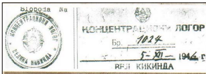
Szerb internálótábor pecsétje, 1946

A Vajdaság Autonóm Tartomány Képviselőházának 2000. december 11-i határozata alapján a Vajdaság II. világháborús veszteségeinek kutatására bizottságot hoztak létre, hogy a jövőben elkerüljék „az ezekkel az eseményekkel történő rosszindulatú napi politikai manipulációkat”. A bizottság sokéves kutatómunkájának eredményét ebben az esztendőben elektronikus kiadásban, összesen kilenc kötetben tették közzé, amely sajnos csak szűk politikai és szakmai körökben érhető el. Három kötet területenként (Bácska és Baranya, Bánát, Szerémség), a többi öt kötet pedig nemzetiségi megoszlásban (szerbek, zsidók, németek, magyarok és egyéb nemzetiségek) közlik az áldozatok névsorát, a születési évre, a nemre, a halál helyére és évére vonatkozó adatok megjelölésével. A bizottság kutatásai szerint a Vajdaság korabeli területén (Bácska, Bánát, Baranya és Szerémség) 1941 és 1948 között igazolhatóan – azaz név szerint azonosítva – 83 881 fő vált a háború