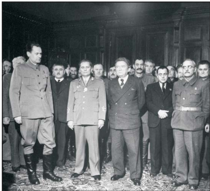
Az új jugoszláv kormány, 1945. február