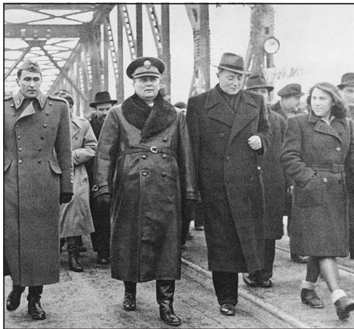
Tito és kísérete az újvidéki Duna-hídon, 1945

angol és amerikai delegációja is. A Külügyminisztériumot egy 1945 júniusában „igen baráti hangnemben” folytatott beszélgetés során a SZEB jugoszláv delegátusának gazdasági vezetője, Gavrilović arról biztosította, hogy „a Bácskában semmiféle magyar üldözés nincs és nem volt”. A megtorlások nem szerepeltek a SZEB üléseinek napirendjei között, habár az angol és amerikai delegátusoknak voltak ezzel kapcsolatos információik.