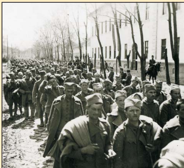
Magyar honvédek szerb hadifoglyokat kísérik, 1941