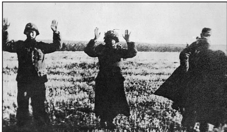
A szerémségi fronton elfogott német katonák, 1944