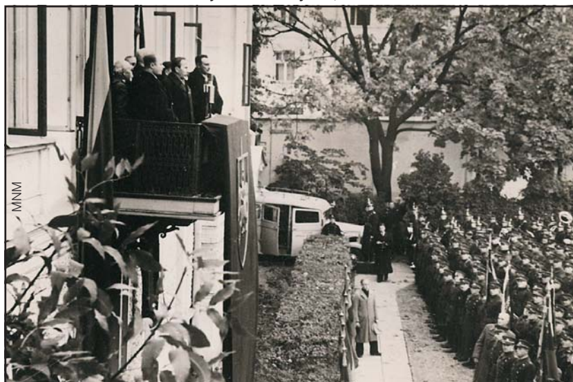
Lengyelország német megszállását követően az 1920 óta Lengyelországhoz tartozó Vilniust a Vörös Hadsereg foglalta el, majd átadta a Litván Köztársaságnak. A Vilnius megszállására induló katonákat Smetona litván elnök búcsúztatja háza erkélyéről, 1939. október.

A többségi nemzetek beolvastási törekvései miatt az 1930-as évek végéig közel ötszáz panasz érkezett a Nemzetek Szövetségéhez 18 kisebbség ügyében. Ezek közül 131 a német kisebbségekkel foglalkozott. A panaszok közül az 1920-as évek végén és az 1930-as évek elején éves átlagban 30–35-öt találtak megalapozottnak. Ezek túlnyomó többsége a szervezet Kisebbségi Bizottságának, illetve Tanácsának szintjén elintéződött. Ilyen ügy volt például az 1920. évi magyarországi numerus clausus törvény, ami ellen 9 panasz érkezett, s a magyar kormányt csak 1928-ra sikerült rábírni az enyhítésére. Az Állandó Nemzetközi Bíróság