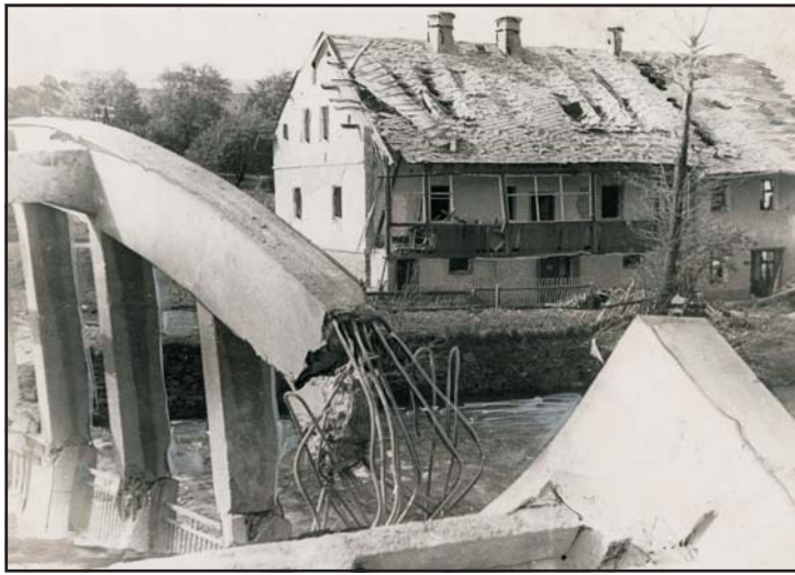
A csehek által felrobbantott híd és iskola a Szudéta-vidéken, Breitenfurtban, 1938