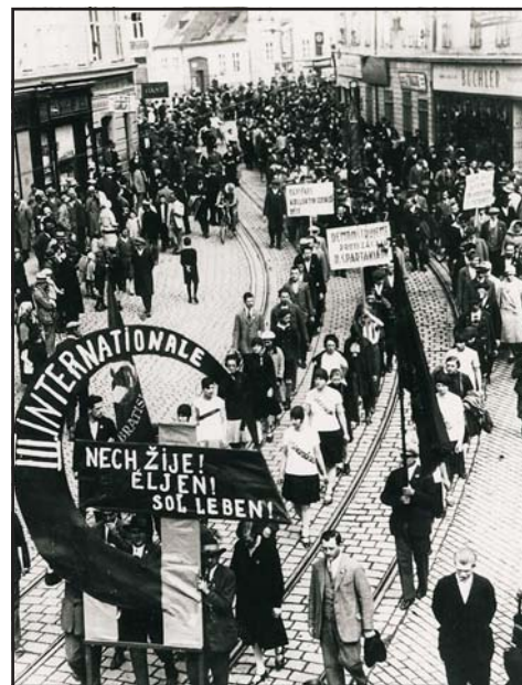
Május elsejei felvonulás Pozsonyban, 1928

A térség jelentős számú kisebbségekkel rendelkező új államai, mindelelőtt Jugoszlávia, Románia s különösen Lengyelország azonban hevesen elleneztek Wilson eszméinek megvalósítását. Mint Paderewski lengyel miniszterelnök kifejezésre juttatta: egy szuverén államtól nem lehet megtagadni azt a jogot, hogy a nemzeti állam eszményét kövesse, s hogy ennek érdekében olyan intézkedéseket léptessen