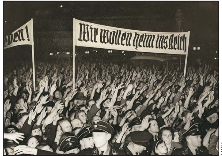
„Haza akarunk térni a Birodalomba!” Nemzeti szocialista tüntetés Gdańskban Göbbels beszéde alatt, 1939. május

az új állam polgára lesz-e, avagy addigi lakóhelyéről eltávozva régi állampolgárságát tartja meg.